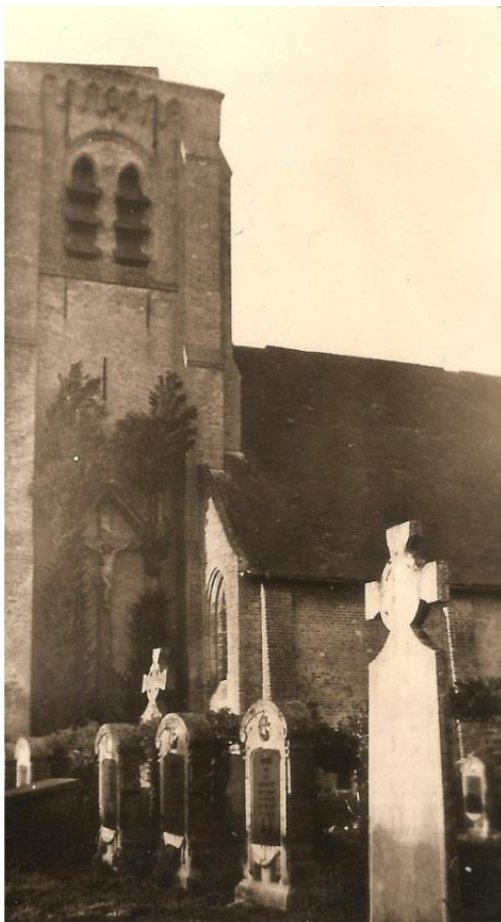
Krijgskerkhof te Oeren Foto M. Van Coppnolle 1948

Doorgereden naar Gyverinkhove. De plaats zonder God. Daar de kerk op de uitkante staat en dus niet op de dorpsplaats spreekt men van een plaats zonder God. Een vriendelijke en leergierige pastoor.