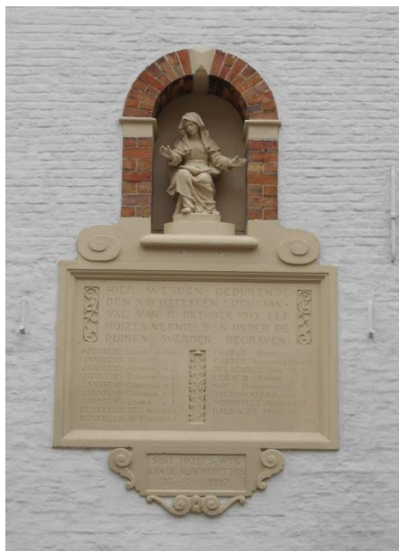
monument na het restaureren en herschilderen

In de periode tussen het opmaken van de prijsofferte en het begin van de restauratie werd de gevel geschilderd in wit en het ornament in wit en grijs. Deze verf was bijna niet meer te verwijderen zonder schade aan te brengen aan de steen. In samenspraak met de dienst Monumentenzorg (Sofie Baert) werd beslist om het monument (behalve de bakstenen nis) te schilderen met een minerale verf in steenkleur om het geheel visueel te herstellen.