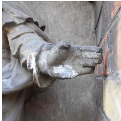
details van de lacunes op het beeld vóór restauratie