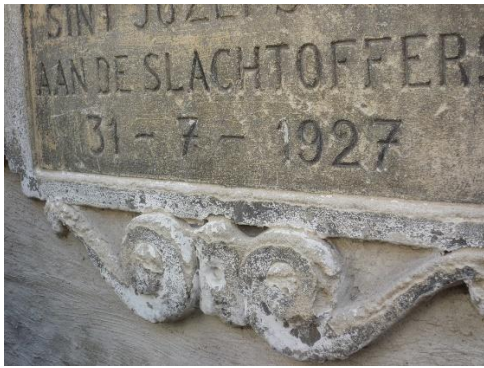
verweerd ornament (2014)