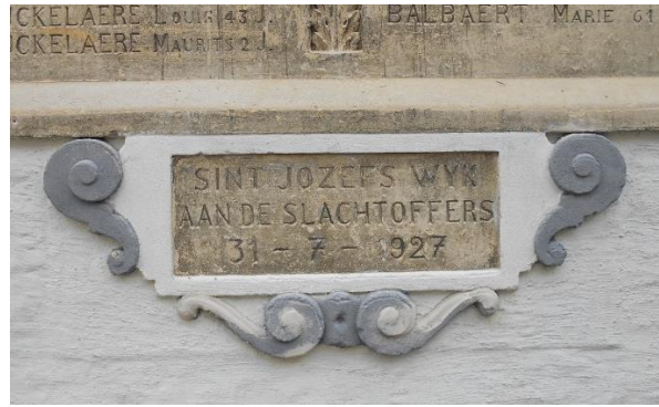
geschilderd ornament in wit en grijs (2017)

Onder de nis bevindt zich een gedenkplaat waarin een tekst betreffende de gebeurtenis en de namen van de slachtoffers gegraveerd is. Bij het bombardement vielen 17 doden en 10 gewonden, bijna allemaal uit de Balsemboomstraat en de Kwekersstraat. Het ornament onder de lijst van de gedenkplaat is verweerd.