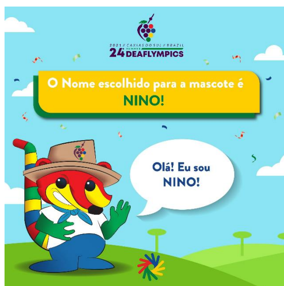
De Mascotte Nino

Voor het eerst vinden de Deaflympics plaats in Latijns Amerika. Caxias do Sul is een stad met een kleine half miljoen inwoners, ongeveer 130 km van de plaatselijke hoofdstad Porte Alegre en 1450 van Rio De Janeiro. Het is gelegen aan de zijde van de Zuidelijke Atlantische Oceaan (ong. 150 km) en 500 km van de grens van Uruguay.