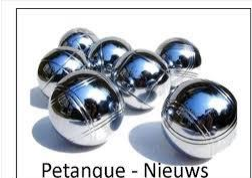
Petanque - Nieuws

Daar er wegens de Coronavirus geen maandelijkse petanque gespeeld wordt dit jaar heeft het bestuur van Doc Den Arend besloten om in de maand mei een petanque te organiseren. (afhankelijk van gunstige coronacijfers!)