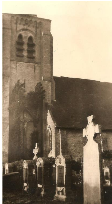
Kerkhof te Houtem. 11 maart 1948