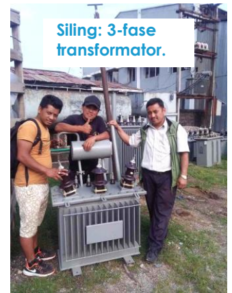
Siling: 3-fase transformator.