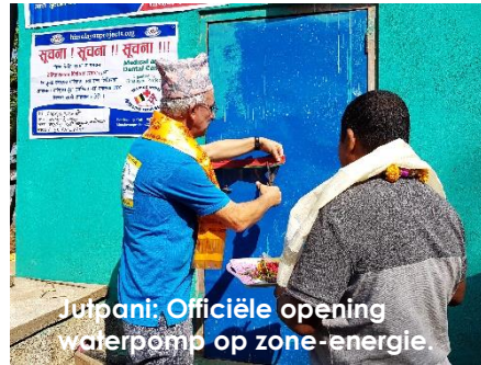
Jurbani: Officiële opening waterpomp op zone-energie.