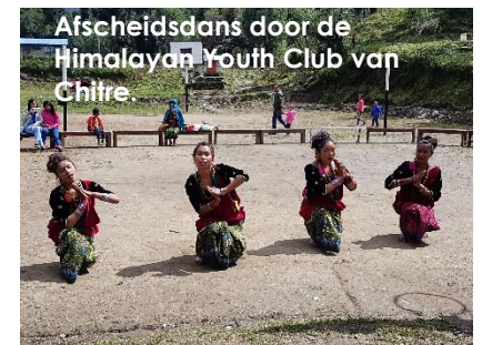
Afscheidsdans door de Himalayan Youth Club van Chitre.