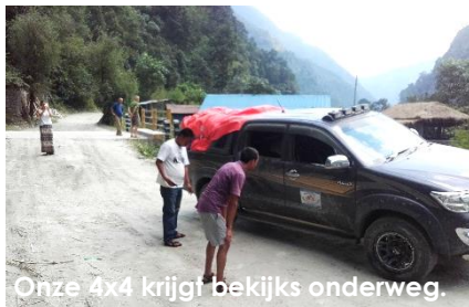
Onze 4x4 krijgt bekijks onderweg.