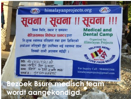
Bezoek Bsurre medisch team wordt aangekondigd.