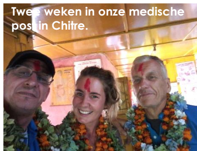
Twee weken in onze medische post in Chitre.