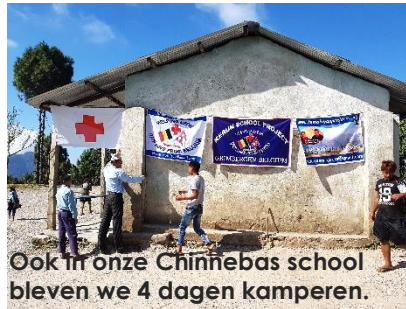
Ook in onze Chinnebas school bleven we 4 dagen kamperen.